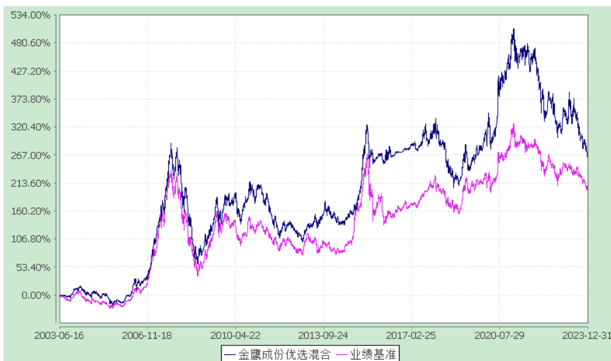
金鹰成份股优选证券投资基金 份额累计净值增长率与业绩比较基准收益率历史走势对比图 (2003 年 6 月 16 日至 2023 年 12 月 31 日)

注：本基金的业绩比较基准为： (\text{上证 180 指数收益率} \times 80\% + \text{深证 100 指数收益率} \times 20\%) \times 75\% + \text{中证全债指数收益率} \times 25\% 。